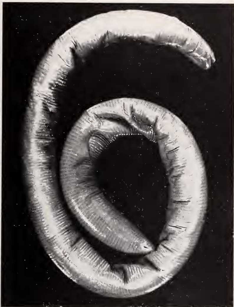
Fig. 2: Ichthyophis bernisi n. sp. Aspecto ventral del holotipo.